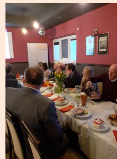
Uczestnicy zebrania Koła Miejskiego w Krośnie