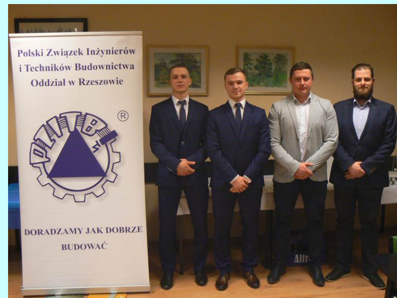
Laureaci konkursu na najlepsze prace dyplomowe

Uroczyste rozdanie nagród odbyło się dnia 06.03.2020 r. w części konferencyjnej Rzeszowskich Targów Budownictwa organizowanych w Hali Sportowej przy ul. Podpromie w Rzeszowie.