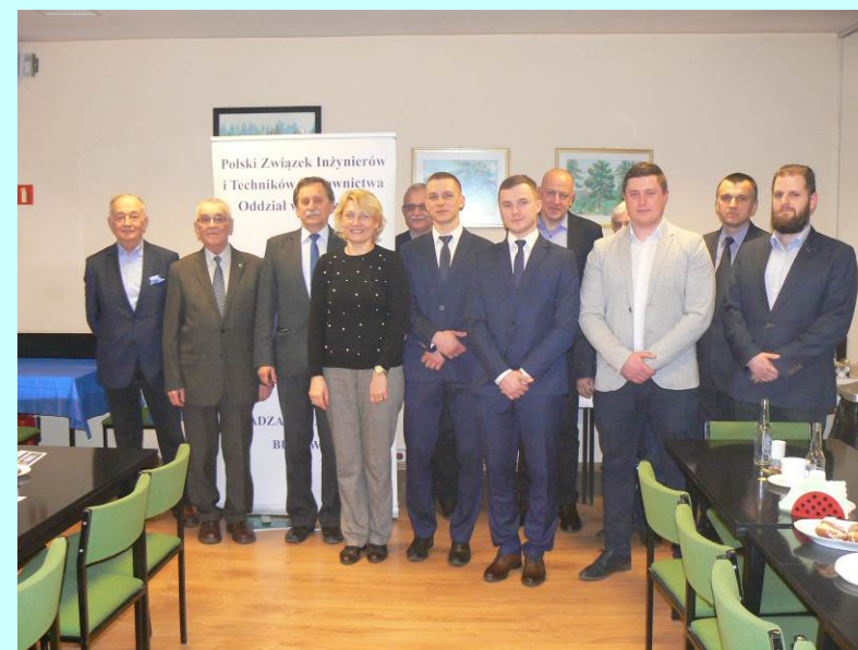
Laureaci wraz z Komisją Konkursową