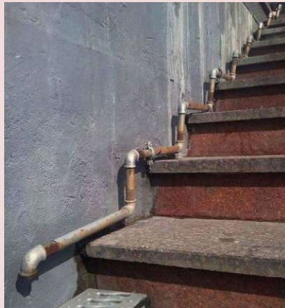
Instalacja wodna czy odbojnica?