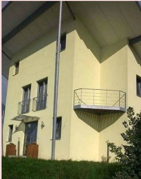
Balkon jakby... opustoszał