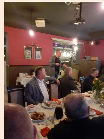
Prelegent - przedstawiciel firmy BASF Chemikal Company

Należy podkreślić, że Koło Miejskie w Krośnie jest bardzo aktywne i już zorganizowało w czasie trwania kadencji 2016-2020 dwa wyjazdy zagraniczne w dniach 25.08-03.09.2017 r. do Albanii, Macedonii i Serbii oraz w dniach 19.08-25.08.2019 r. do Czarnogóry, Bośni i Hercegowiny. Wycieczki te cieszyły się dużym zainteresowaniem wśród uczestników integrując członków Koła oraz ich rodziny, a także wzbogacając wiedzę o kulturze i obyczajach ludzi odwiedzanych krajów.