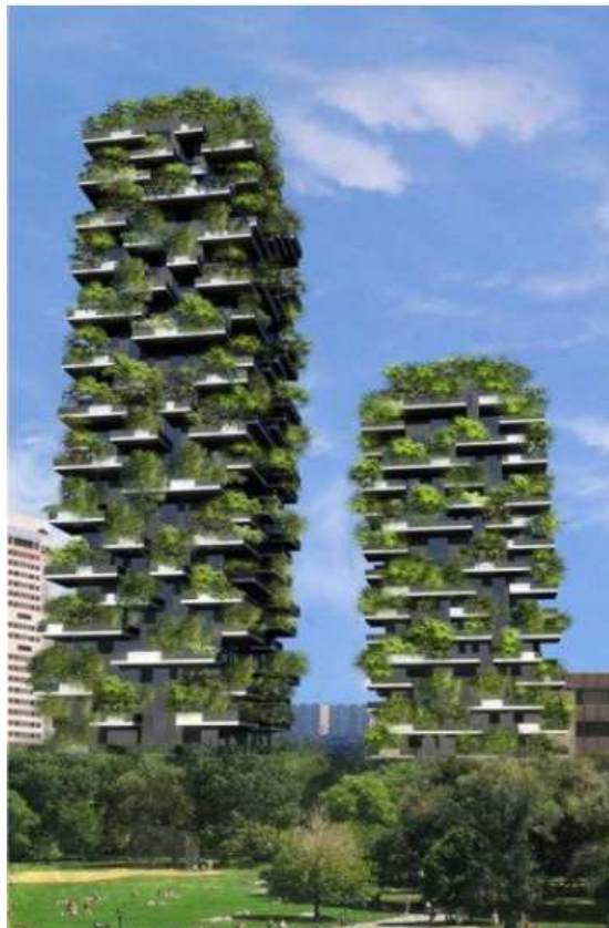
Wartość balkonów w dobie koronawirusa - rośnie!