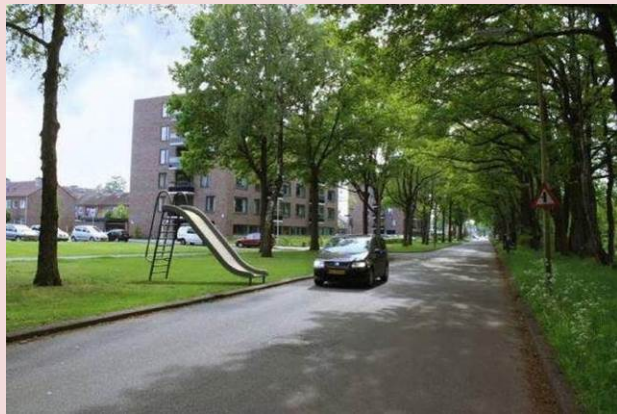
Elementy małej architektury ...